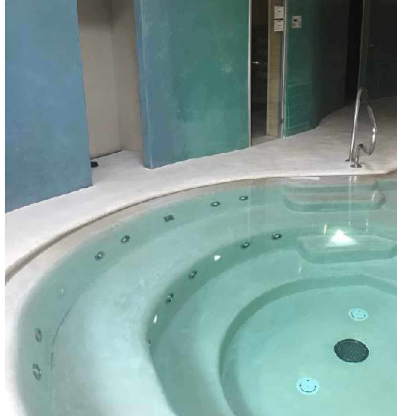
Dettagli di alcune piscine coperte realizzate

Le finiture più naturali ricordano la pietra o la sabbia, ma può assumere l'aspetto del cemento, del mosaico o assolutamente lucida.