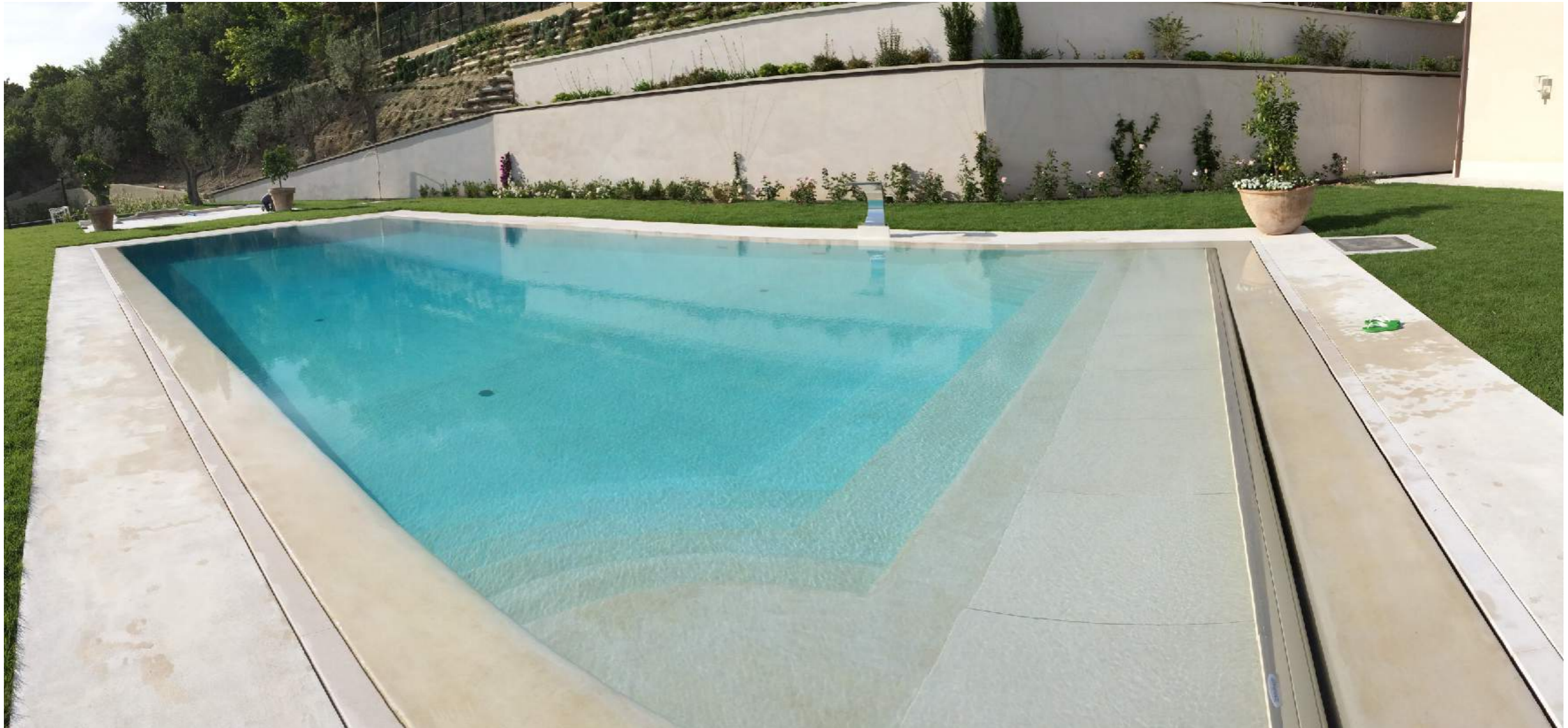
Piscine esterna realizzata con microsabbia