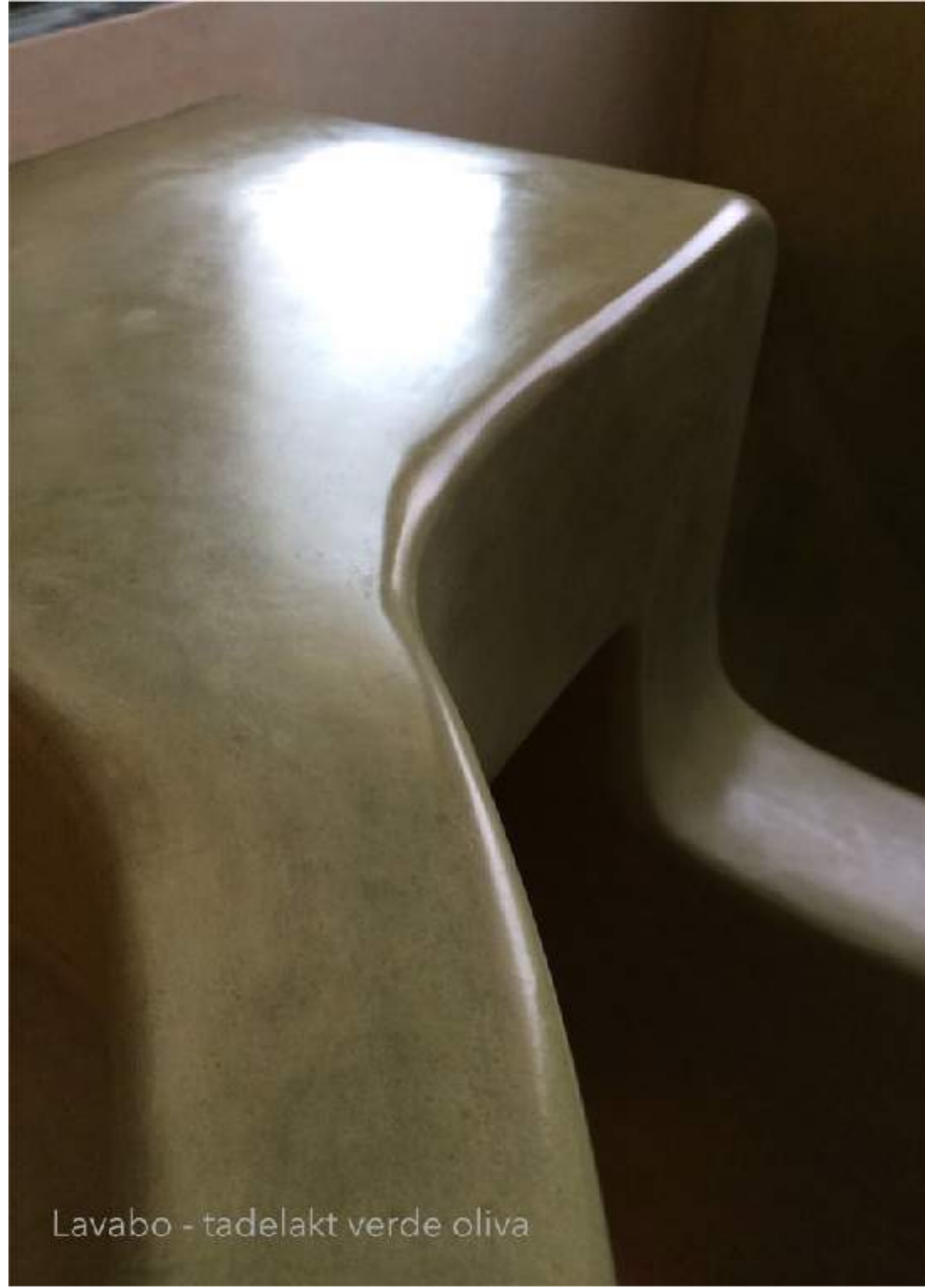
Lavabo - tadelakt verde oliva

La sua composizione naturale, oltre ad avere proprietà battericide e fungicide , lo rende un materiale ideale per la bioarchitettura.