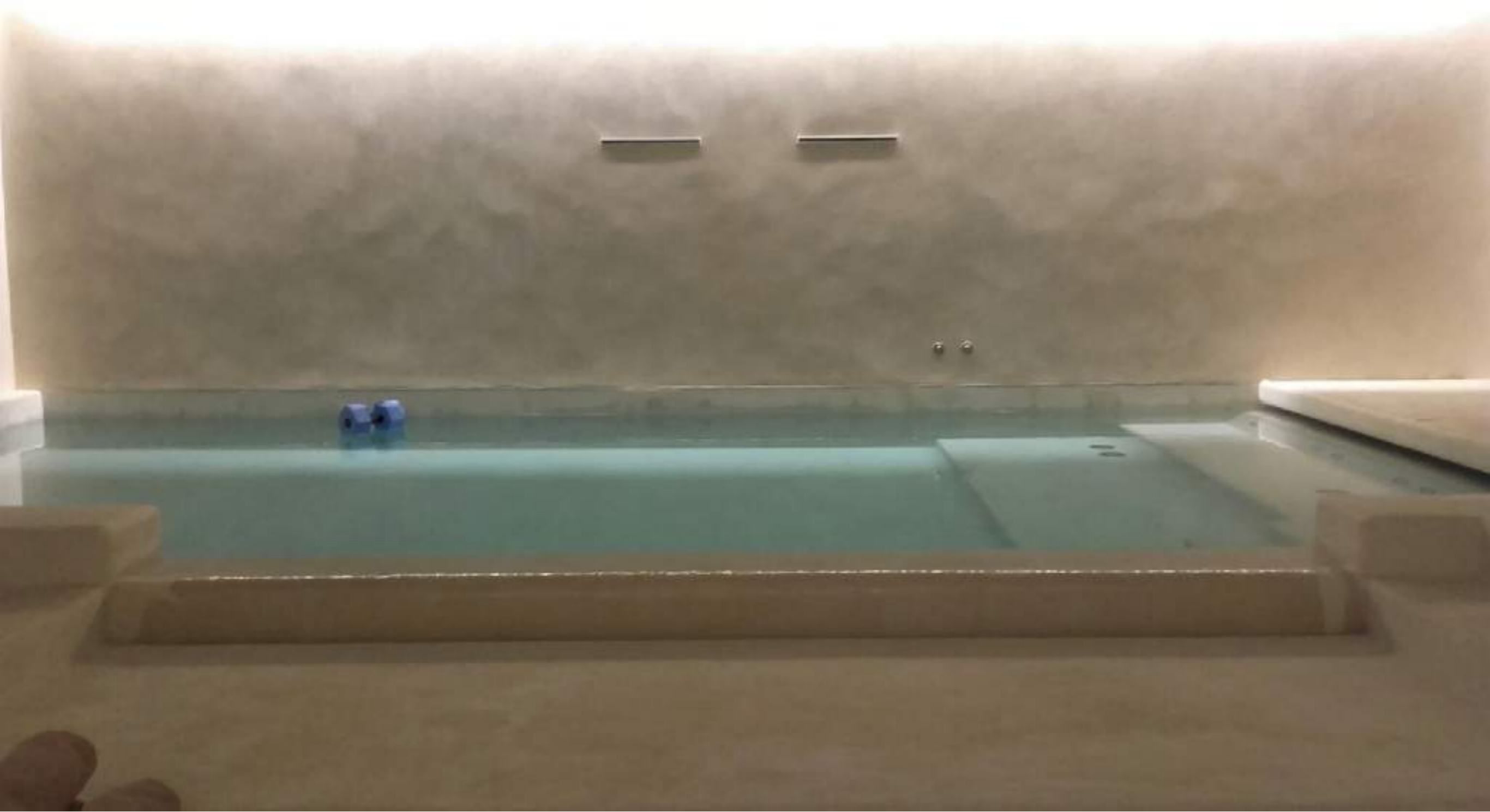
DETTAGLIO PISCINA INTERNA