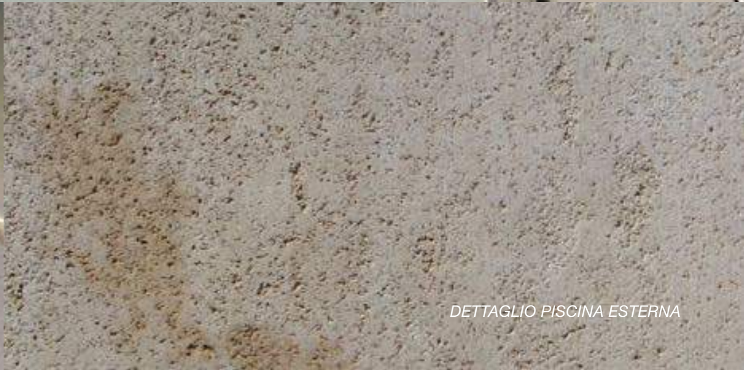
DETTAGLIO PISCINA ESTERNA