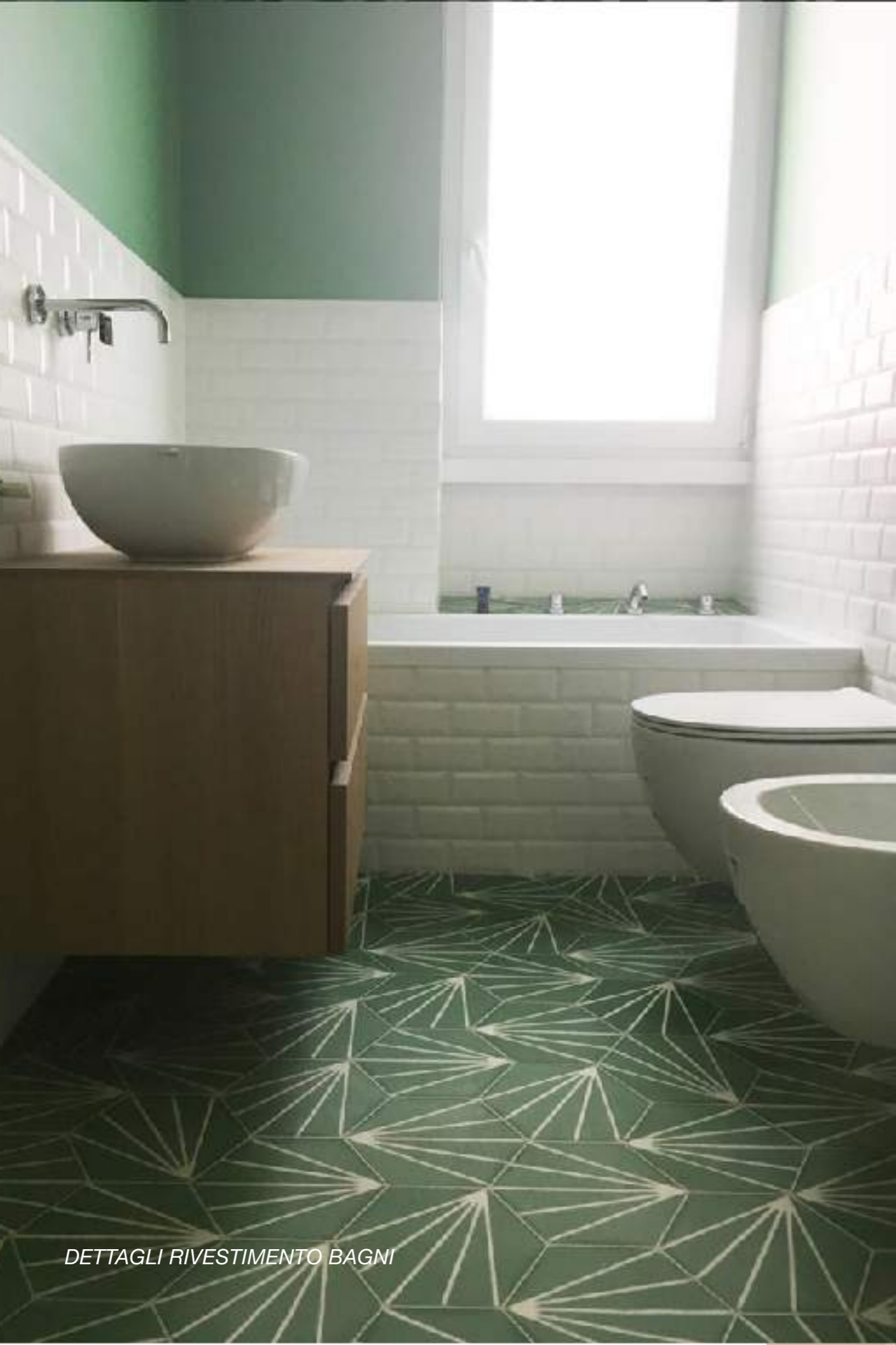
DETTAGLI RIVESTIMENTO BAGNI