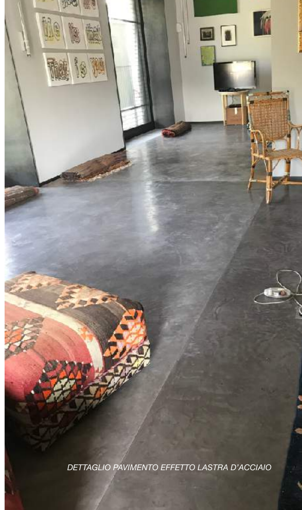
DETTAGLIO PAVIMENTO EFFETTO LASTRA D'ACCIAIO