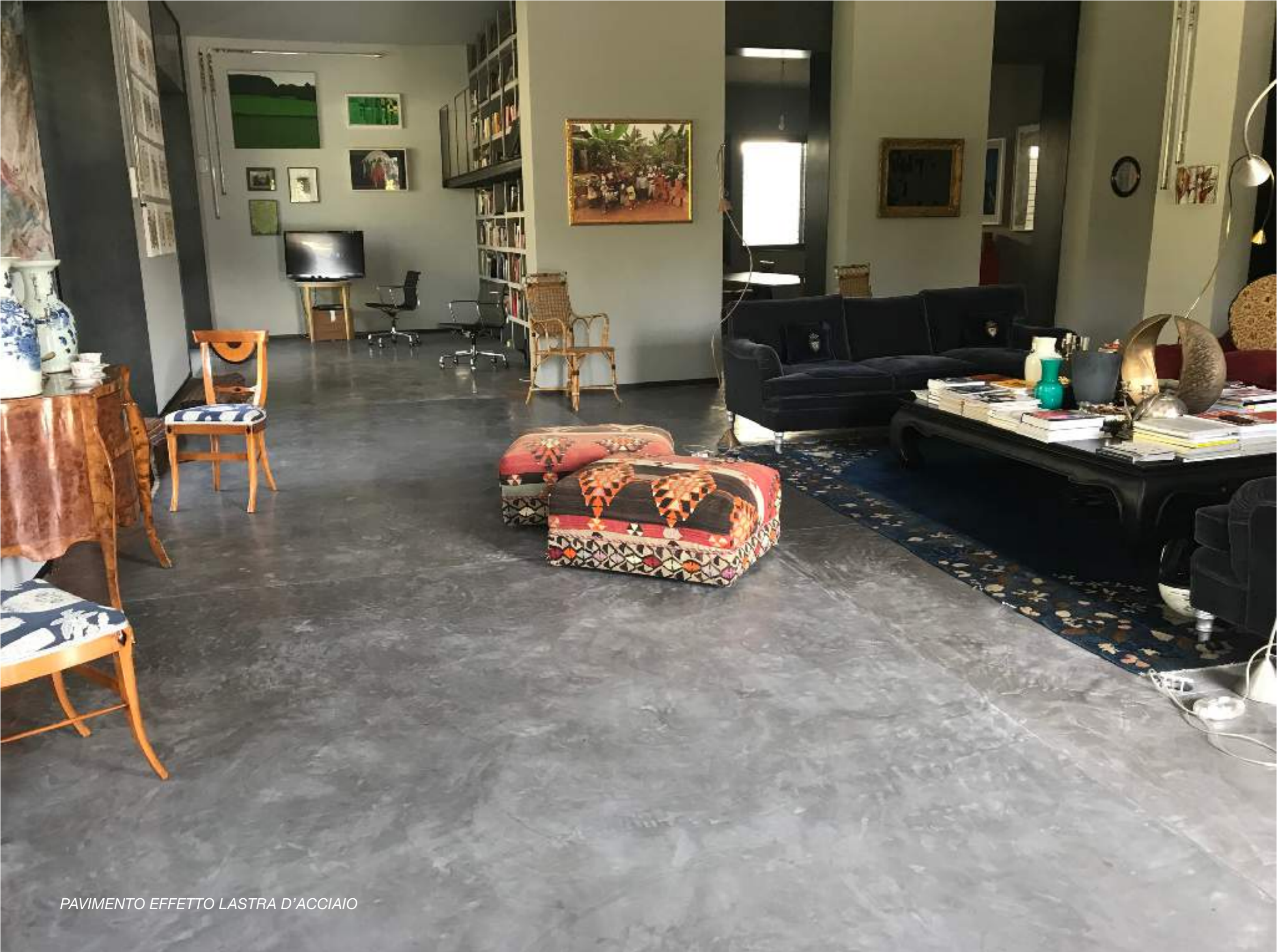
PAVIMENTO EFFETTO LASTRA D'ACCIAIO