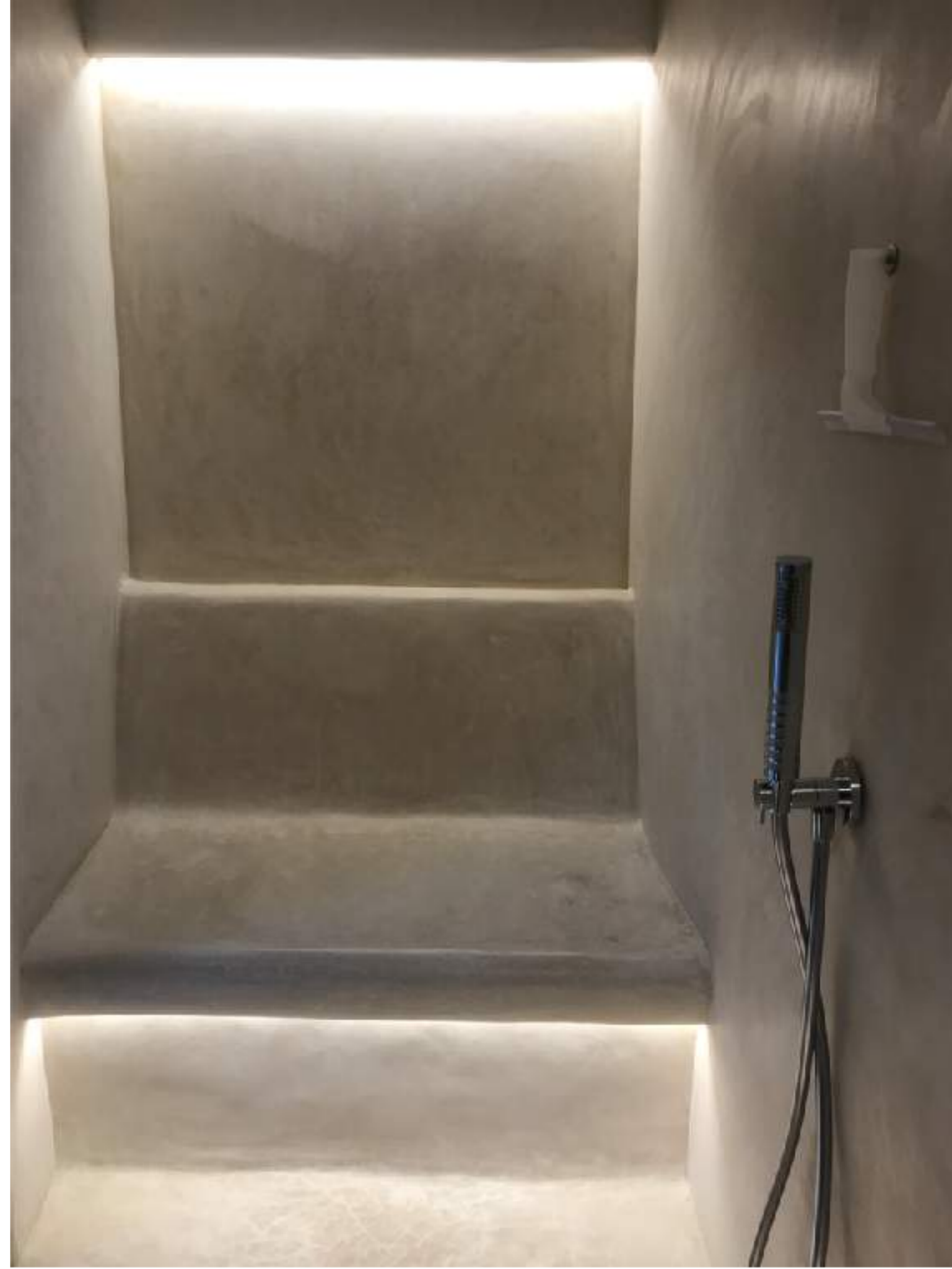
DETTAGLIO BAGNO TURCO IN TADELAKT