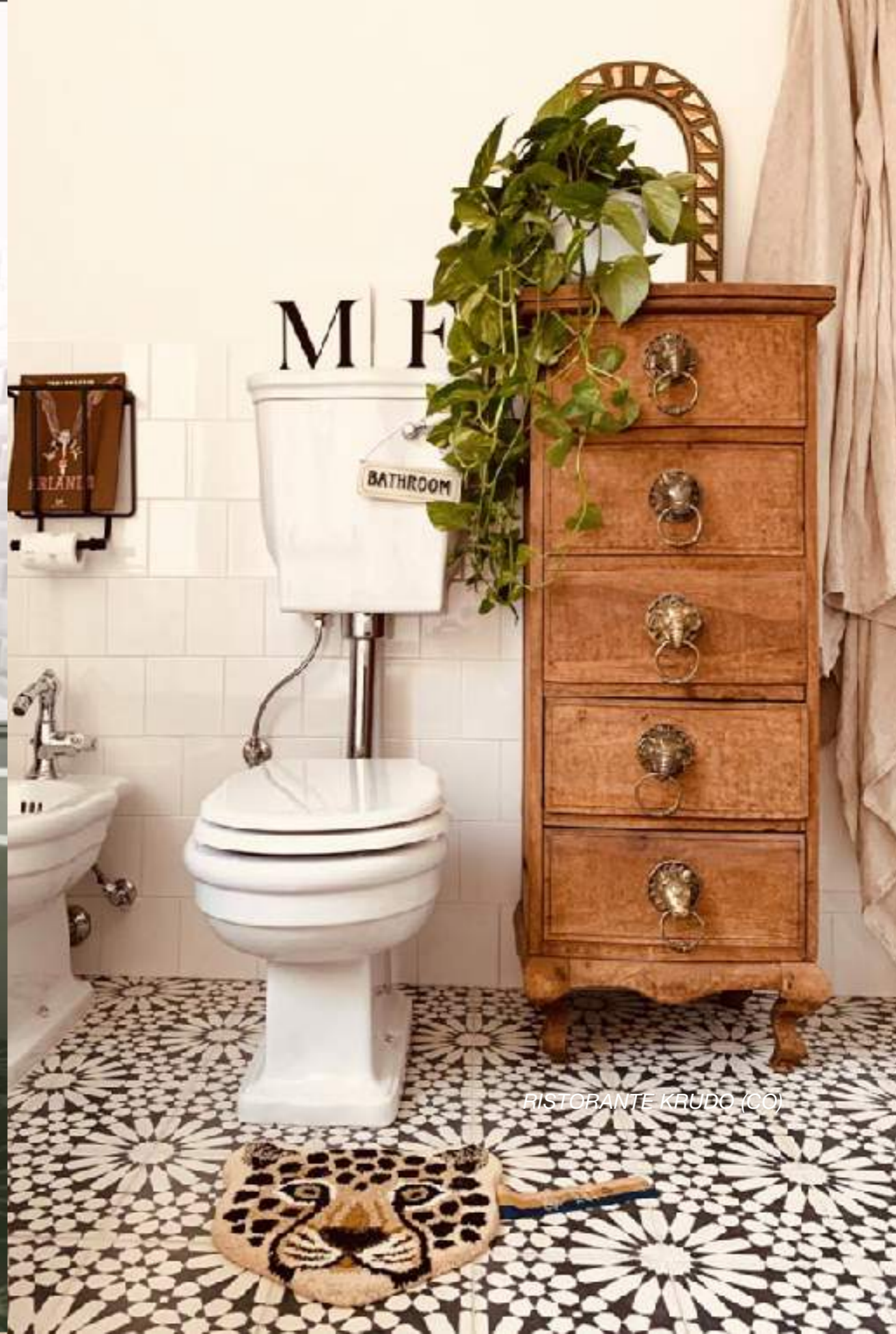
RISTORANTE KRUDO (CO)