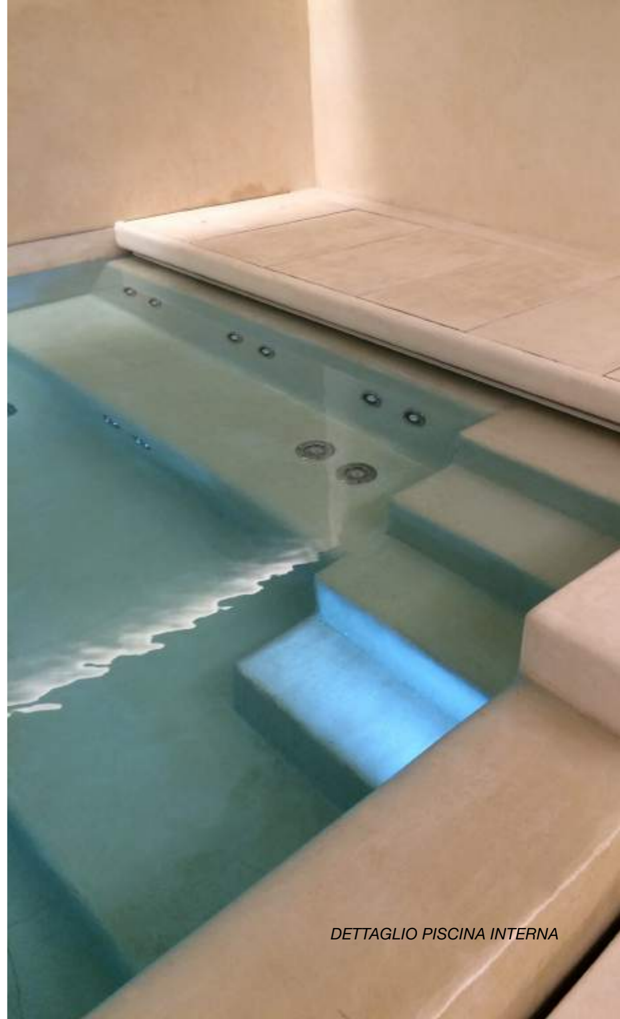
DETTAGLIO PISCINA INTERNA